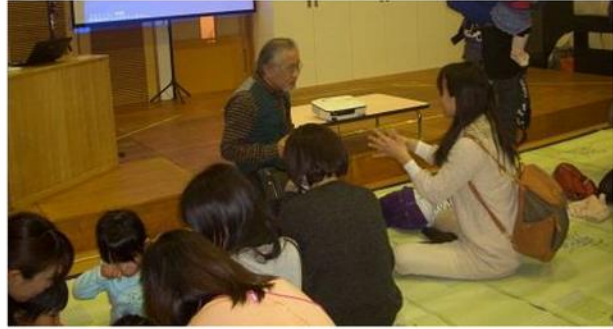
▲イベント終了後、お母さんからの相談風景