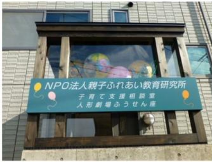
▲親子ふれあい教育研究所